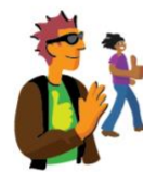
Quartier Échanges du village (Q-4)