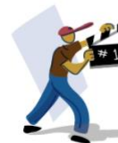
Quartier Studio (Q-6)