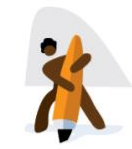
Quartier Artistique (Q-1)

2 e étage, Toronto Reference Library, 13 mai 2026